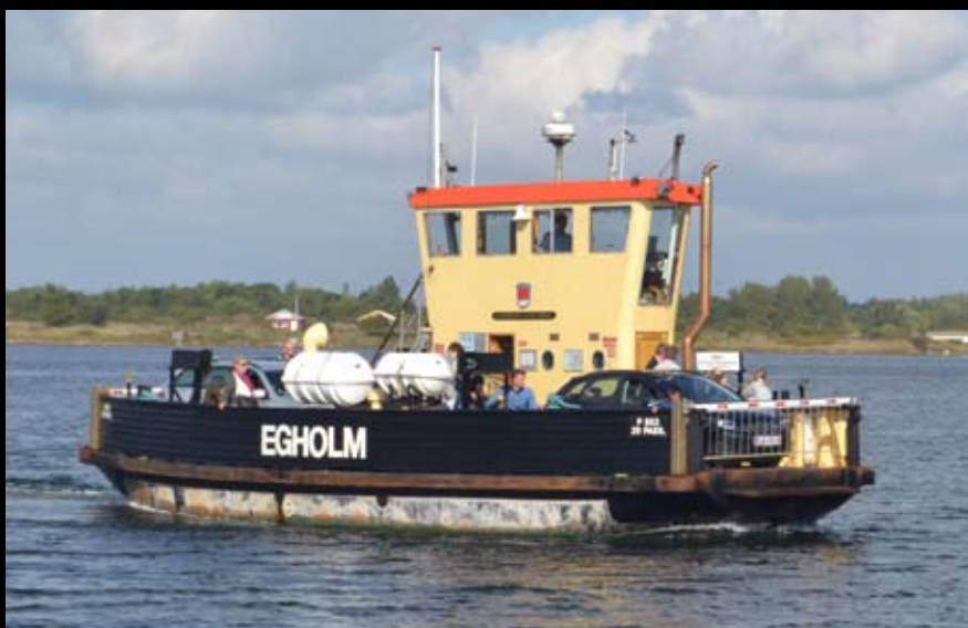
Træfærgen "Egholm" består bl. a. - meget passende - af egetræ. Den skulle have været afløst af stålfærgen "Egholm II", men får lov at sejle på deltid lidt endnu. 13. sep. 2014.

Længst tv.: "Ida" søges bevaret i sommerrute Bogo-Stubbekøbing. 11. september 2014.